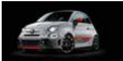
KIT ESTETICO Opt. 5HI