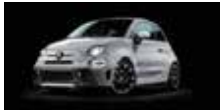
KIT ESTETICO WEISS Opt. 5HM