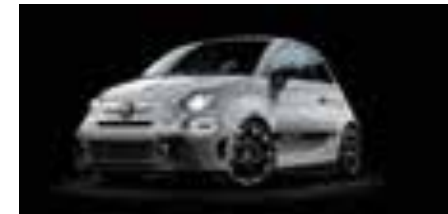
KIT ESTETICO SCHWARZ Opt. 5HN