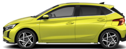
Lucid Lime Metallic Kontrastdach verfügbar