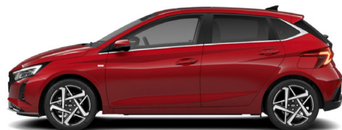
Dragon Red Pearl Kontrastdach verfügbar