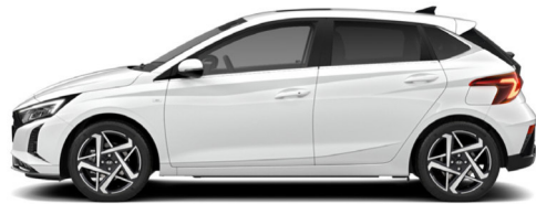
Atlas White Kontrastdach verfügbar