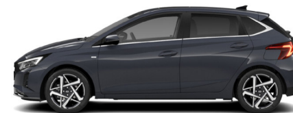
Aurora Gray Pearl