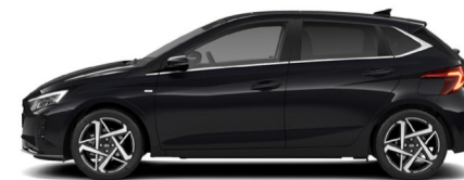
Phantom Black Pearl