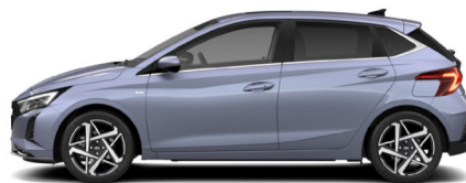
Meta Blue Pearl Kontrastdach verfügbar