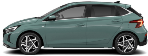
Mangrove Green Pearl Kontrastdach verfügbar