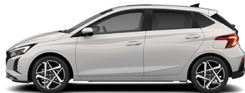
Lumen Gray Pearl Kontrastdach verfügbar