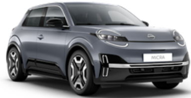
Elegant Silver (KQG)