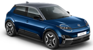
Noble Marine + Grey Roof (YWZ)