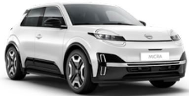
Pure White (369)