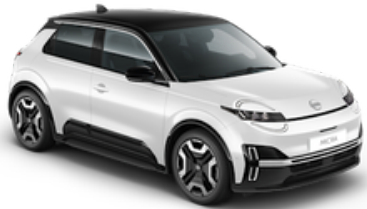
Pure White + Black Roof (XUF)