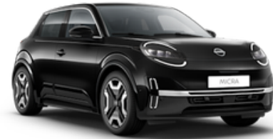
Mystery Black (GNE)