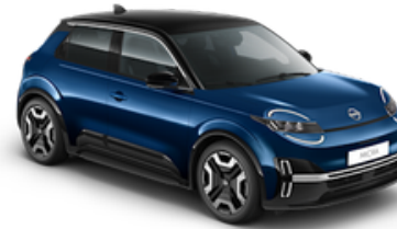
Noble Marine + Black Roof (YWW)