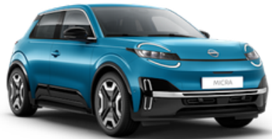
Authentic Blue (RCN)