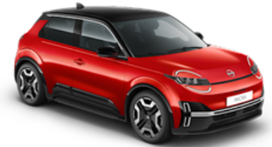
Rebel Red + Black Roof (YZA)