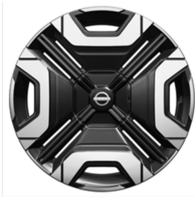
18" Leichtmetallfelgen "Iconic"