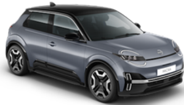
Elegant Silver + Black Roof (YUY)