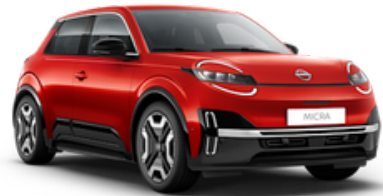
Rebel Red (NPT)