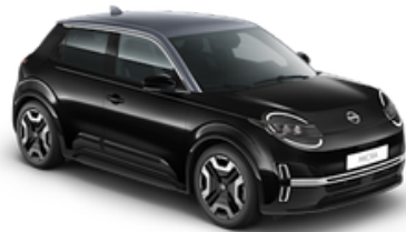
Mystery Black + Grey Roof (YWX)