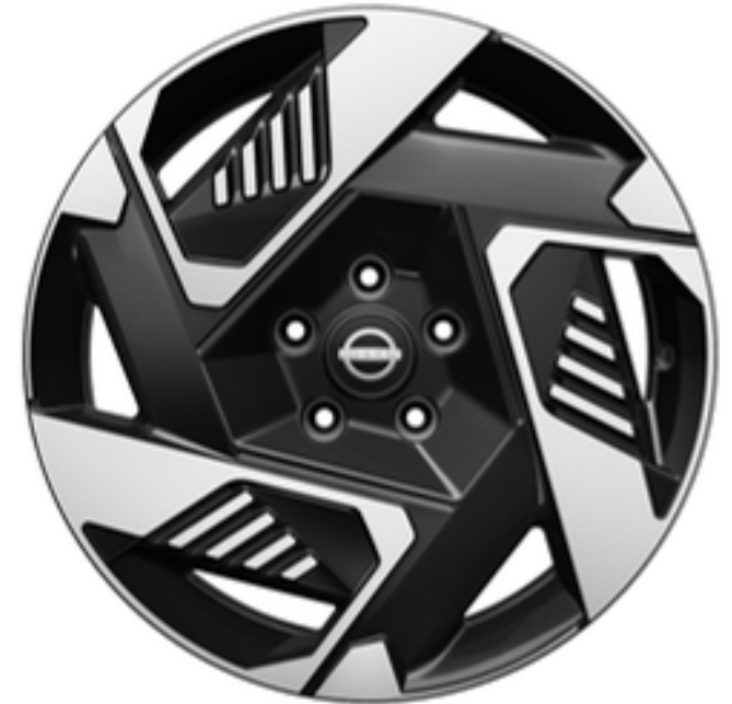
18" Leichtmetallfelgen "Sport"