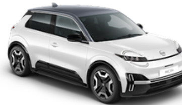
Pure White + Grey Roof (YWY)