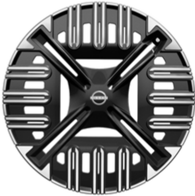
18" Stahlfelgen mit Radabdeckung "Active"