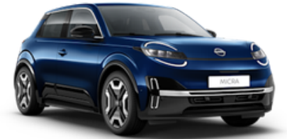
Noble Marine (RRE)