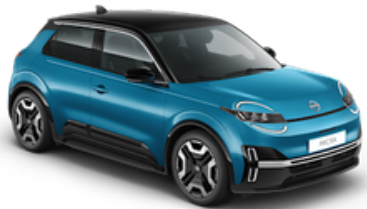
Authentic Blue + Black Roof (YZF)